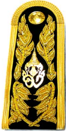
รูปแบบที่ ๒ อินทรธนู