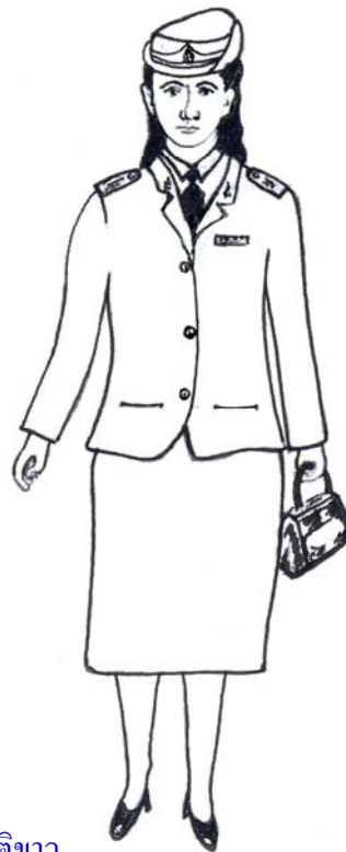
รูปแบบที่ ๓ ชุดปกติขาว