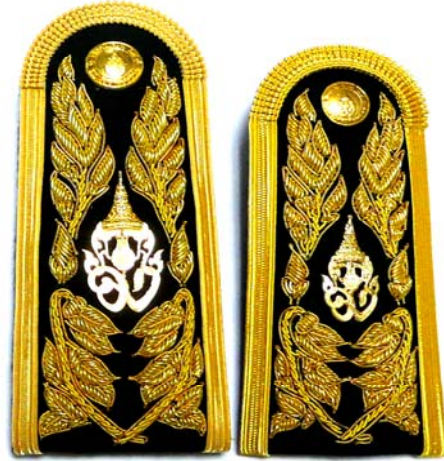
รูปแบบที่ ๕ อินทรธนูชายและหญิง